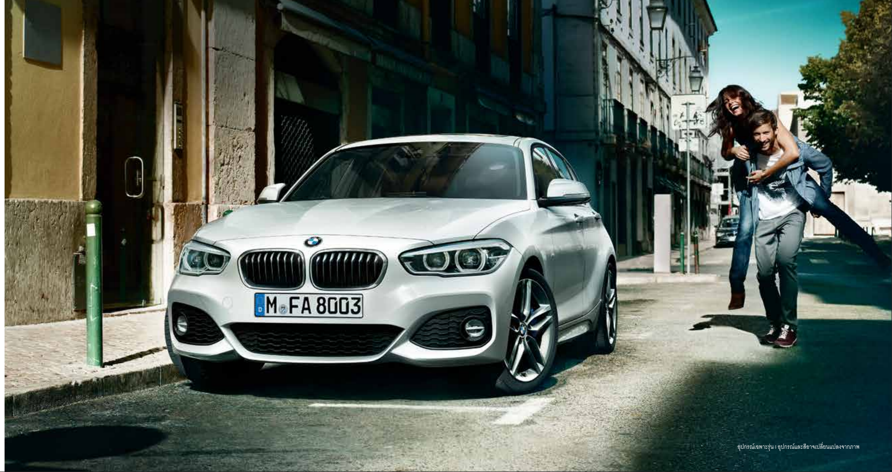
อุปกรณ์เฉพาะรุ่น | อุปกรณ์และสีอาจเปลี่ยนแปลงจากภาพ