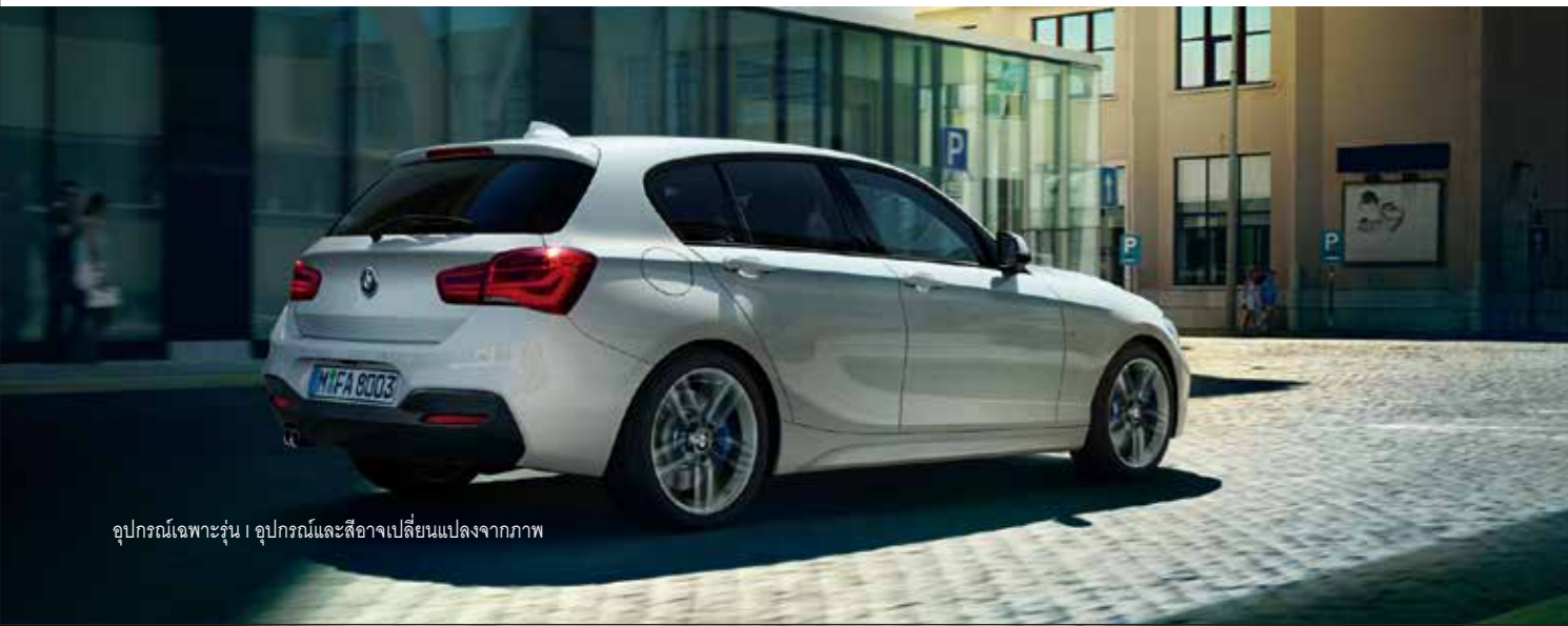
อุปกรณ์เฉพาะรุ่น | อุปกรณ์และสีอาจเปลี่ยนแปลงจากภาพ

บทพิสูจน์ที่ปฏิเสธไม่ได้ของการผจญภัยที่ล้ำสมัย และรูปลักษณ์ของการออกแบบที่มีเอกลักษณ์อย่างลงตัว บีเอ็มดับเบิลยู ซีรีส์ 1 มาพร้อมที่สุดแห่งสมรรถนะและความปราดเปรียว ด้วยการออกแบบอันโดดเด่น อาทิ เส้นสายบนกันชนหน้าที่ยาวต่อเนื่อง แสดงให้เห็นถึงพลังงานอันเหลือล้นของบีเอ็มดับเบิลยู ซีรีส์ 1 ไฟหน้าทีดูเรียบง่ายแต่โดดเด่น ผลิตรจากเทคโนโลยีหลอดไฟ LED ที่ชี้ไปที่จุดศูนย์กลางในส่วนหน้าของรถ ซึ่งก็คือกระจกหน้าที่ถูกห่อหุ้มด้วยโครงเมียมอันเป็นเอกลักษณ์เฉพาะของบีเอ็มดับเบิลยู นอกจากนี้แนวหลังคาที่สูงและประตูที่กว้าง ทำให้สะดวกต่อการเข้า-ออก ทั้งหมดคือการออกแบบรูปลักษณ์ที่โดดเด่น พร้อมสะกดทุกสายตาดังแม้จะจอดนิ่งก็ตาม